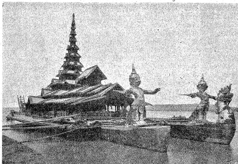
Barken des letzten Königs von Birma.