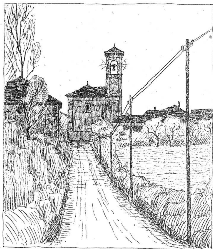
Bei Ligornetto, Cessin.

Wenn wir die Entwicklung des Heimatschutzgedankens in seinem Einfluß auf das Bauwesen verfolgen, so sehen wir, wie man anfangs hauptsächlich das Gebäude als Einzelobjekt im Auge hatte. In den letzten Jahren geht man weiter: Man tritt ein für die Erhaltung ganzer Städte- und Dorfbilder, und beim Entwerfen von Bebauungsplänen nehmen architektonisch-ästhetische Erwägungen immer mehr den ihnen gebührenden Platz ein; Städtebau steht heute im Vordergrund des Interesses. Mit den abseits der Ortschaften liegenden Land- und Feldstraßen aber hat sich der Heimatschutz bis jetzt noch wenig befaßt, mit Unrecht, denn