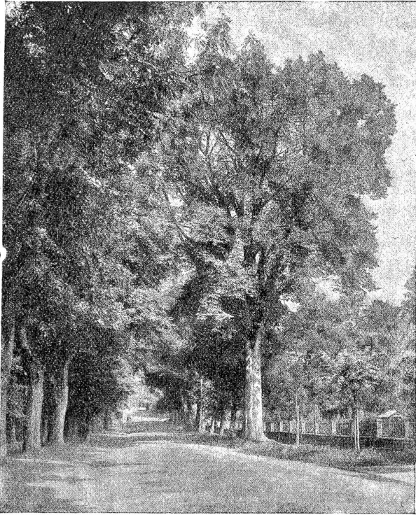
Strasse nach Muri bei Bern.

die Art der Bodenbearbeitung eine andere ist und mehr Wagen verwendet werden, werden eventuell noch bestehende derartige Fußpfade leider mehr und mehr entweder aufge-