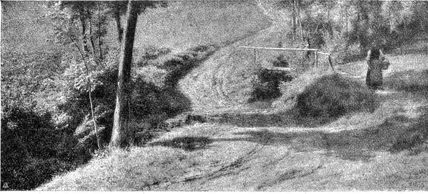
Wiesenweg und Bachlauf. Nach einer Oelstudie von Robert Zünd.

die Augen. „Es ist nicht bloß so eine Grille von mir, halt weil mir Euer Gesicht und Euer Tun gefällt. Ich weiß nicht, woher das kommt, aber ich meine immer, Euch hätte ein anderer gehört.“ Er stockte und biß sich auf die Lippen.