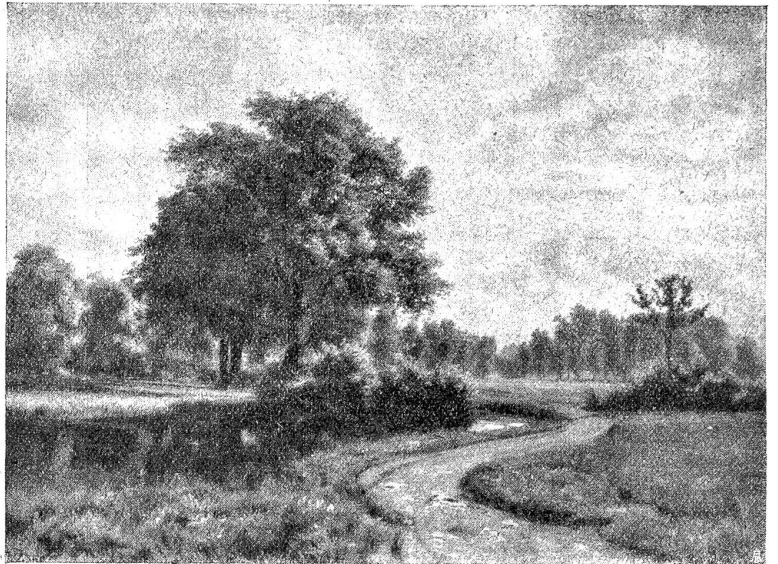
Wiesenweg, einem Wasserlaufe folgend. Nach einer Oelstudie von Robert Zünd.

In Deutschland wählt man oft Obstbäume zu Straßenbäumen. Speziell mit großen, hochstämmigen Arten, mit Nuß- und Kirschbäumen, erreicht man auf diese Weise sehr gute Wirkungen. Vor dem Kriege schwankte in Deutschland der Ertrag der Obstbäume zwischen 40 und 80 Mark per