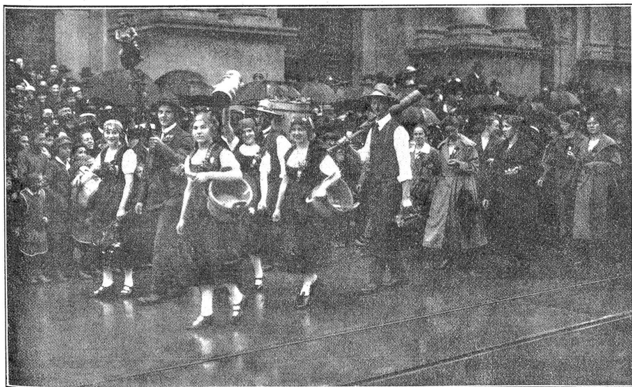
Vom bernischen Kantonalgesangfest in Bern: Gruppe aus dem Festzug (Winzerinnen).

Die II. Hauptaufführung vom Montag nachmittag ludte wiederum eine gewaltige Menschenmenge nach der Festhalle. Die Darbietungen überstiegen aber auch wirklich alles Vorangegangene. Schon Berlioz' Ouverture zu Benvenuto Cellini wußte Fritz Brun zu einer eigentlichen Fest-Ouverture zu gestalten. Das Jubilieren der Geigen entsprach so recht der freudetrunknen Stimmung, die aus allen Gesichtern leuchtete. Nach einigen schlichten a capella-Liedern für gemischten Chor folgte eine weitere Ueberraschung. Kammerfänger Karl Erb aus München sang Introduction und Arie des Florestan aus Beethovens „Fidelio“ mit einer Vollendung, die nicht nur tiefstes Empfinden, sondern auch herrliche Stimmittel erkennen ließ. Sein Tenor