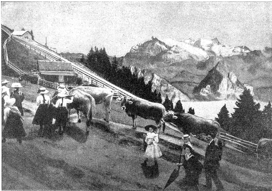
Zum fünfzigjährigen Jubiläum der Viknau-Rigibahn: Zwischen Staffel und Kulm.

süchtige Zöpflin, das sie hinten zu einem geizigen Knäuelchen aufrollte, das scharfe Kinn, alles war da, und ein dunkles Nestchen im Holz saß genau auf der Nasenspitze und sah aus wie das schwarze Tröpfchen, das der Alten immer dort zittert. Denn sie gibt sich lästerlich mit Schnupftabak ab. Nun, sage mir einer, wie kam der verfluchte Kerl dazu, dergleichen ohne Lehre ins Holz zu schnitzen? Ist das natürlich? Ich kam mir neben ihm wie ein Lehrbube und Armenhändler vor, und verstehe doch mein Handwerk, der Vater da kann's bezeugen. Aber das Beste kommt