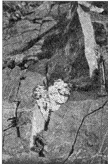
Helvetischer Mannschild ( Androsace helvetica ). Von einer Felsenpartie im Schweizerischen Nationalpark.

Die Anstrengungen der Heimat- und Naturschützer haben ohne Zweifel Erfolg gehabt. Der Unfug des Blü-