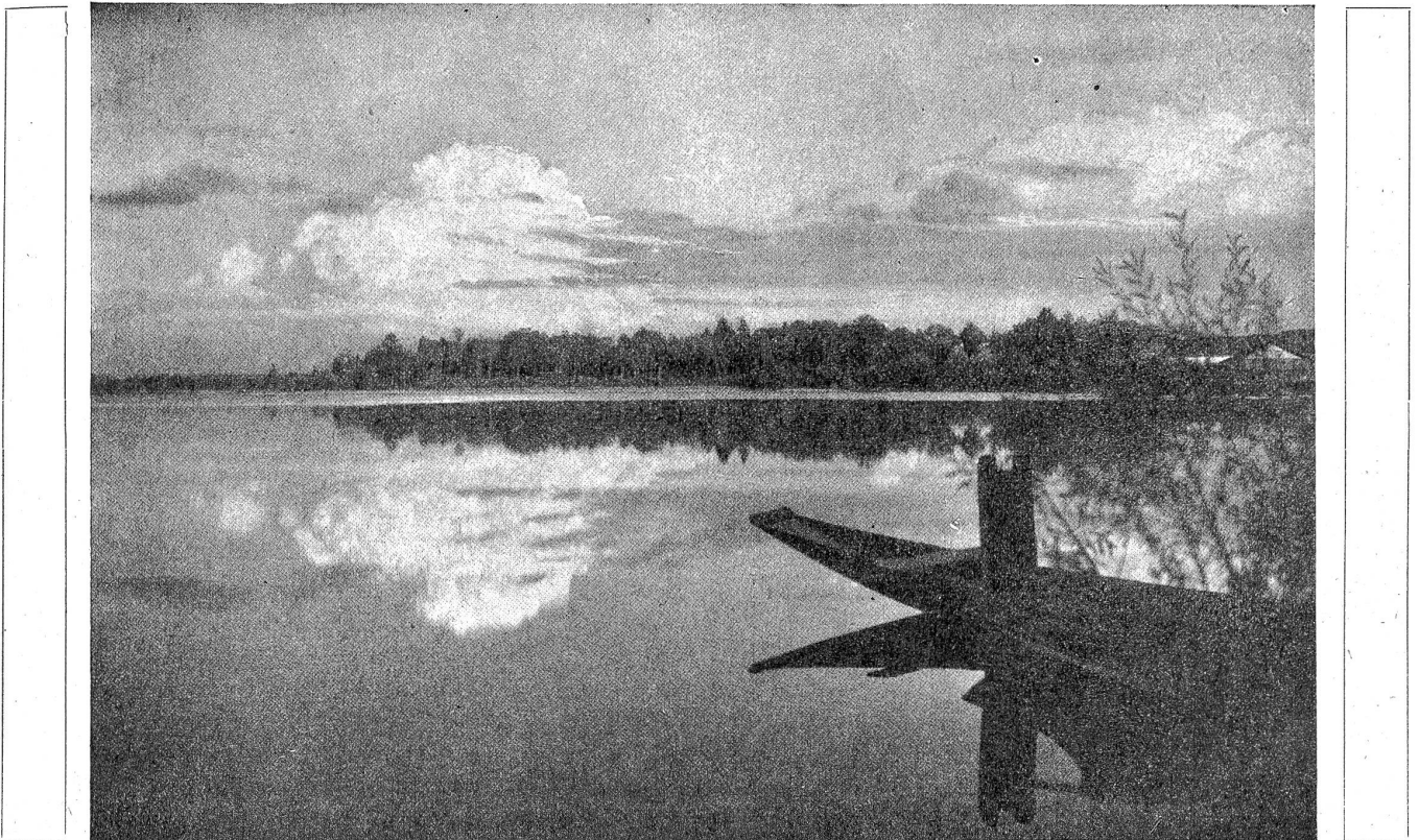
Am Katzenssee (Kt. Zürich). Rechtes Ufer des größeren Sees. Von links nach rechts: Birkenwäldchen, Badeplatz, Staatswaldung, Eisschuppen.

Eltern war Licht, ich sah's am Schlüsselloch, und drin hörte ich ein schmerzliches Wimmern. Wie ich zum Haus und zum Dorf hinauskam und auf welcher Straße ich in die Fremde lief, weiß ich nicht. Meine Gedanken fingen erst wieder zu schaffen an, als mir die Sonne in die Augen blitzte und ich auf einem Kreuzweg das Wandern nach meinem Schatten begann."