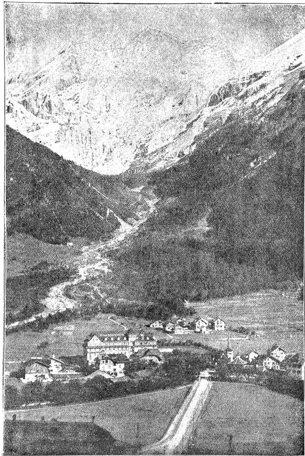
Kandersteg mit Blümlisalpborngruppe.

Mitte Juni — Reijewetter! Es ist Zeit, daß ich Euch wieder einmal heraushole aus Eurer Einsiedelei und mit Euch auf Reisen gehe; sonst versauert Ihr mir ganz: Du Onkel, bei Deinen Zeitungen und Du Tante, bei Deinen Strickstrümpfen. Dieses Jahr habe ich schöne Reisepläne geschmiedet; der eine oder andere soll Euch passen. Du Onkel sagtest mir neulich, daß Du noch nie durch den Lötschberg gefahren seiest — Tante natürlich erst recht nicht — Ihr sollt jetzt mit der Lötschbergbahn fahren und zwar von A. bis Z. Bekanntlich verlegt man — d. h. die Lötschbergbahn-Direktion auf ihren Eisenbahnkarten — in neuester Zeit das A. will heißen den Anfang der Lötschbergbahn, nach Basel; da seid Ihr also gerade am richtigen Ort zum Einsteigen. In B. = Bern macht Ihr den obligaten Halt und schaut Euch den Bärengraben, wollte sagen: unsere Kinderstube an — der „Lulu“ wackelt, patst (im Wasch-