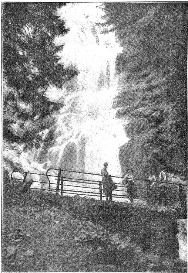
Der Dündenfall im Kiental.

ihm seine Suppe einzulöffeln. Was hätte es auch genützt? Er wäre in den Boden geschlüpft. Einer nach dem andern schlich davon, mich aber packte es von innen und ich schrie: „Der Teufel ist los, der Teufel ist los!“ So lief ich die Gasse hinunter und nach Hause.