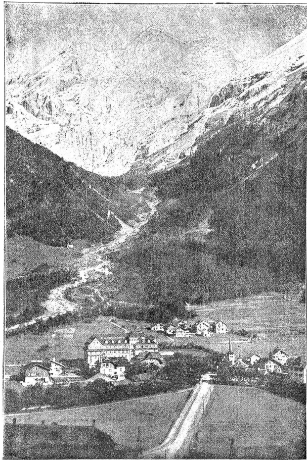
Kandersteg mit Blümlisalpbornguppe.

Mitte Juni — Reijewetter! Es ist Zeit, daß ich Euch wieder einmal heraushole aus Eurer Einsiedelei und mit Euch auf Reisen gehe; sonst versauert Ihr mir ganz: Du Onkel, bei Deinen Zeitungen und Du Tante, bei Deinen Strickstrümpfen. Dieses Jahr habe ich schöne Reisepläne geschmiedet; der eine oder andere soll Euch passen. Du Onkel sagtest mir neulich, daß Du noch nie durch den Lötschberg gefahren seiest — Tante natürlich erst recht nicht — Ihr sollt jetzt mit der Lötschbergbahn fahren und zwar von A. bis Z. Bekanntlich verlegt man — d. h. die Lötschbergbahn-Direktion auf ihren Eisenbahnkarten — in neuester Zeit das A. will heißen den Anfang der Lötschbergbahn, nach Basel; da seid Ihr also gerade am richtigen Ort zum Einsteigen. In B. = Bern macht Ihr den obligaten Halt und schaut Euch den Bärengraben, wollte sagen: unsere Kinderstube an — der „Lulu“ wackelt, patst (im Wasch-