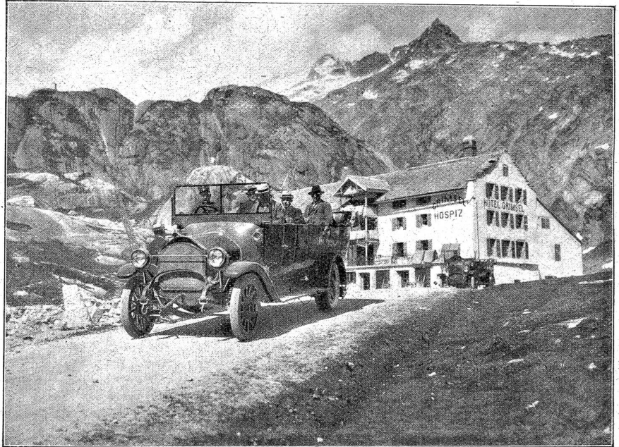
Das Postautomobil beim Grimsel Hospiz.

Da steht unsere gesamte Presse von der Linken, die leider die Funktionen des Geldes ignoriert, bis zur Rechten, die sie oft zu gut versteht, um alles sagen zu können, was zu sagen wäre, steht da und konstatiert: In England geht der Diskontosatz zurück — ein gutes wirtschaftliches Wetterzeichen! Das heißt so viel wie: Die hohen Diskontosätze waren schlimme wirtschaftliche Wetterzeichen. Das legt die Frage nahe: Wäre es möglich, die Diskontosätze