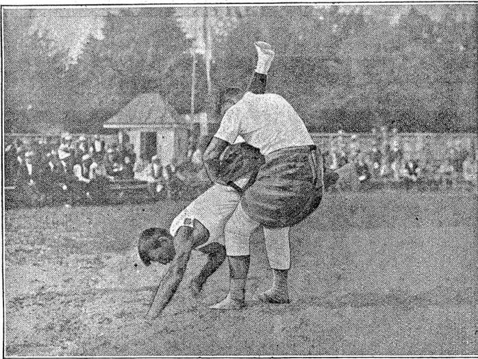
Eidg. Schwing- und Aelplerfest Bern. Honegger, Rütli — Kunz, Meinsberg.

plauderer, auf den wir gerne in Wort und Bild zurückkommen werden. —