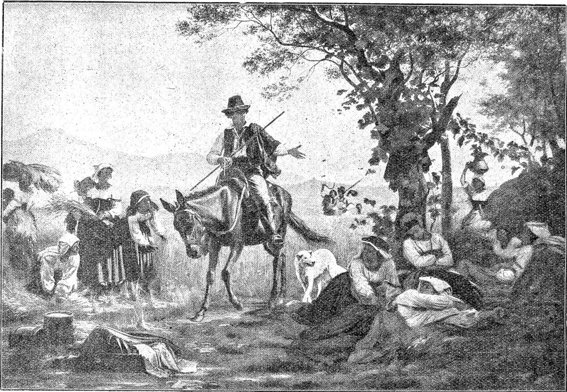
August Weckesser: Die fleissigen und die faulen Schnitterinnen.

mischer Chor studierte kurzerhand alte katholische Messstücke ein, die man der erhöhten Feierlichkeit wegen und weil niemand den Text verstehen konnte, lateinisch sang. Dieser Chor spaltete sich in verschiedene Abteilungen; Kindergruppen wurden zugezogen und eingeübt, und unter dem Namen einer den Gottesdienst neubelebenden Liturgie wurde, nur versuchsweise, ein wackeres kleines Dramolet in Szene gesetzt, aus welchem sich mit der Zeit wieder die pomphafte Darstellung eines Weltmysteriums gestalten konnte.