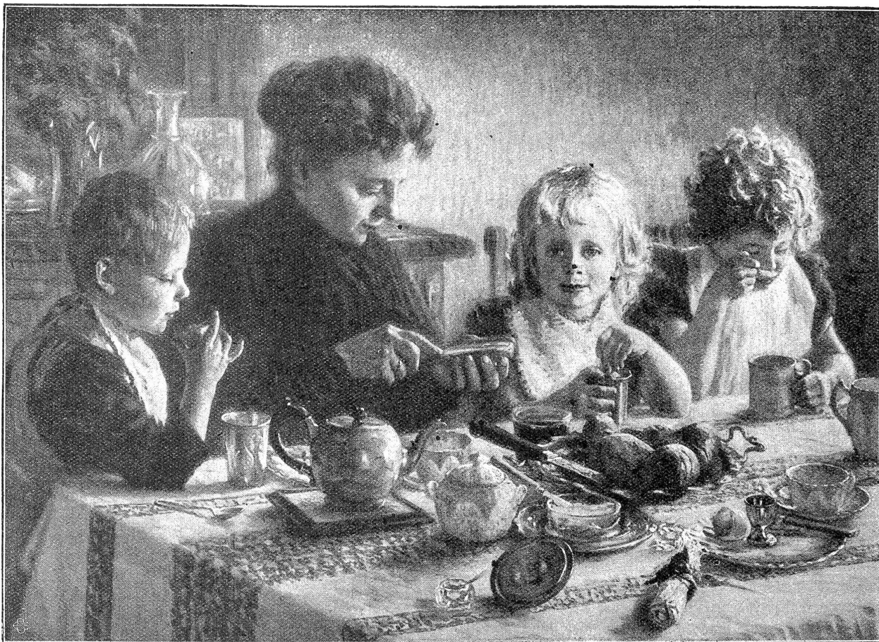
Beim Frühstück. Nach einem Gemälde von Julius Meißner.

redten und starken Worten, daß sie in ihrer weißen Zipfelhaube die wahre Stauffacherin zu sein schien und die letztere sich weinend ans Fenster stellte.