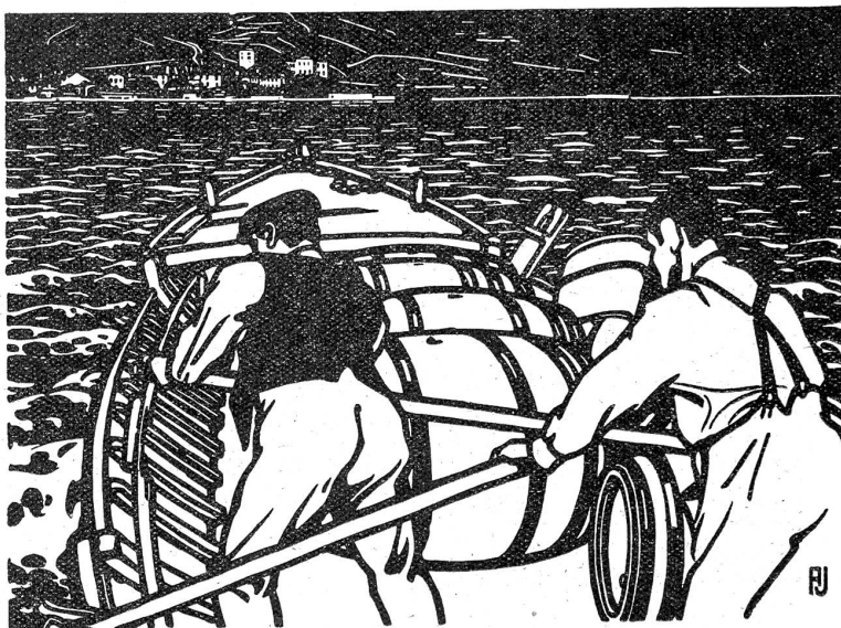
Der Eichel-Wein schwimmt nach Cwamm. (A. Jaeger-Engel.)

Der Name „Oktober“ kommt vom lateinischen octo = acht, weil er bei den Römern der achte Monat war, nicht der zehnte, wie jetzt. Der von Kaiser Karl dem Großen in seiner Monatsreihe eingeführte Namen „Windumemanoth“ ist dem Lateinischen nachgebildet, kommt von vindemia = Weinlese. Die Slaven nennen den Oktober „gelber Monat“, vom Farbenwechsel der Blätter ausgehend. In einigen Gegenden Deutschlands heißt der X. Eichelmonat, weil die