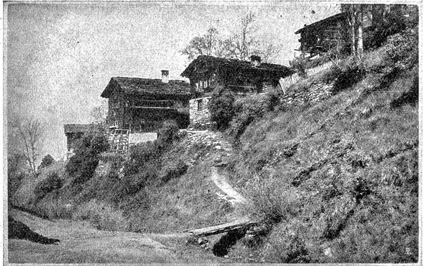
Walliser Dörfchen. Wandhütten.

Er bleibt mit seinen Plänen liegen, schlummert unvermerkt ein und erwacht erst am hohen Morgen, als ein