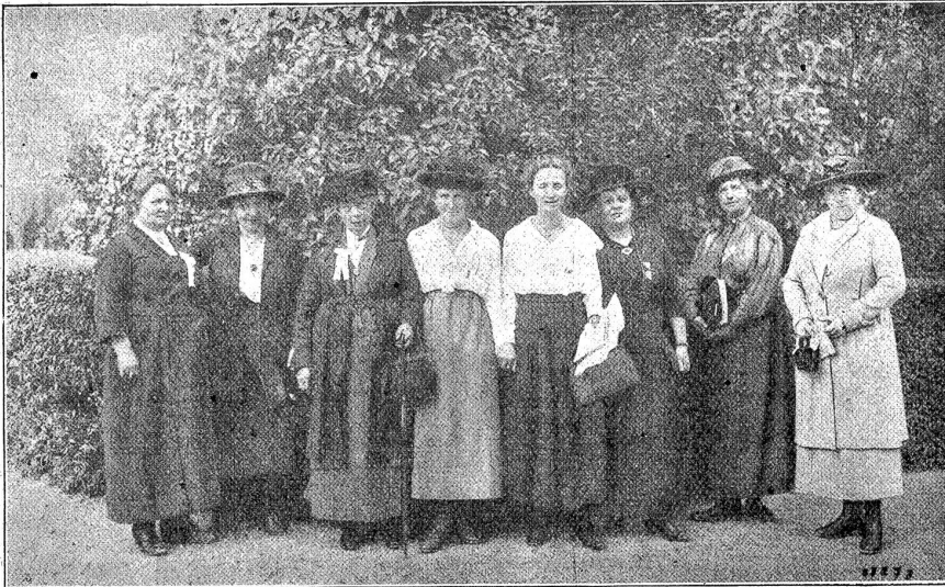
Vom II. Schweiz. Frauenkongress in Bern 1921. — Das Organisationskomitee.