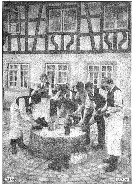
Lehlingsheim Oberwinterthur, „Schulputete“.

Den Schulentlassenen soll die diesjährige Sammlung zugute kommen. Die Lehr- und Reifejahre der Jugend sind für die Fürsorge die schwerste, umfangreichste, — die dankbarste Aufgabe. In dieser Zeit bricht das in den letzten Schuljahren oft einschlämmernde Gefühlsleben wieder aus dem Innersten auf, alle Zugänge in die Seele sind geöffnet.