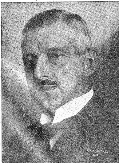
Dr. Robert Haab, Bundespräsident für das Jahr 1922.

Die Verteilung der eidgenössischen Departemente. Der Bundesrat hat in außerordentlicher Sitzung über die Verteilung der Departemente im Jahr 1922 Beschluß gefaßt: Politisches Departement: Motta. Stellvertreter: Schultzeß. — Inneres: Chuard. Stellvertreter: Häberlin. — Justiz und Polizei: Häberlin. Stellvertreter: Haab. — Militär: Scheurer. Stellvertreter: Chuard. — Finanzen