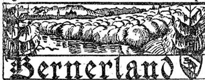
† Charles Schlegel, gewesener Instruktor der Artillerie in Thun.

Gegen die bestehenden Zollformalitäten wendet sich die Schweizerische Verkehrszentrale mit einer Eingabe an den Bundesrat. Darin wird verlangt, daß die Zollformalitäten sowohl bei der Ein- als bei der Ausreise seitens beider angrenzenden Staaten im gleichen Grenzbahnhof erfüllt werden können; daß in den durchgehenden Zügen und Wagen die Zollrevision des Handgepäcks und die Paßkontrolle in den Wagen selbst vorgenommen werde; daß durch die kürzlich getroffenen Maßnahmen für die Anwendung des neuen Zolltarifs der internationale Reise- und Fremdenverkehr nicht gefährdet werde. —