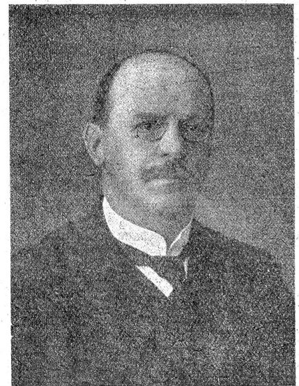
Karl Scheurer, Vizepräsident des Bundesrates für das Jahr 1922.