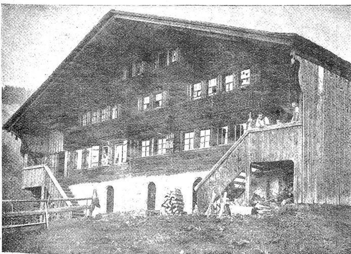
Alte Saanenhäuser. In der Biffen (erbaut 1608).

Wer etwas Treffliches leisten will, hatt' gern was Großes geboren, der sammle still und unerschlaft im kleinsten Punkte die höchste Kraft. Schiller.