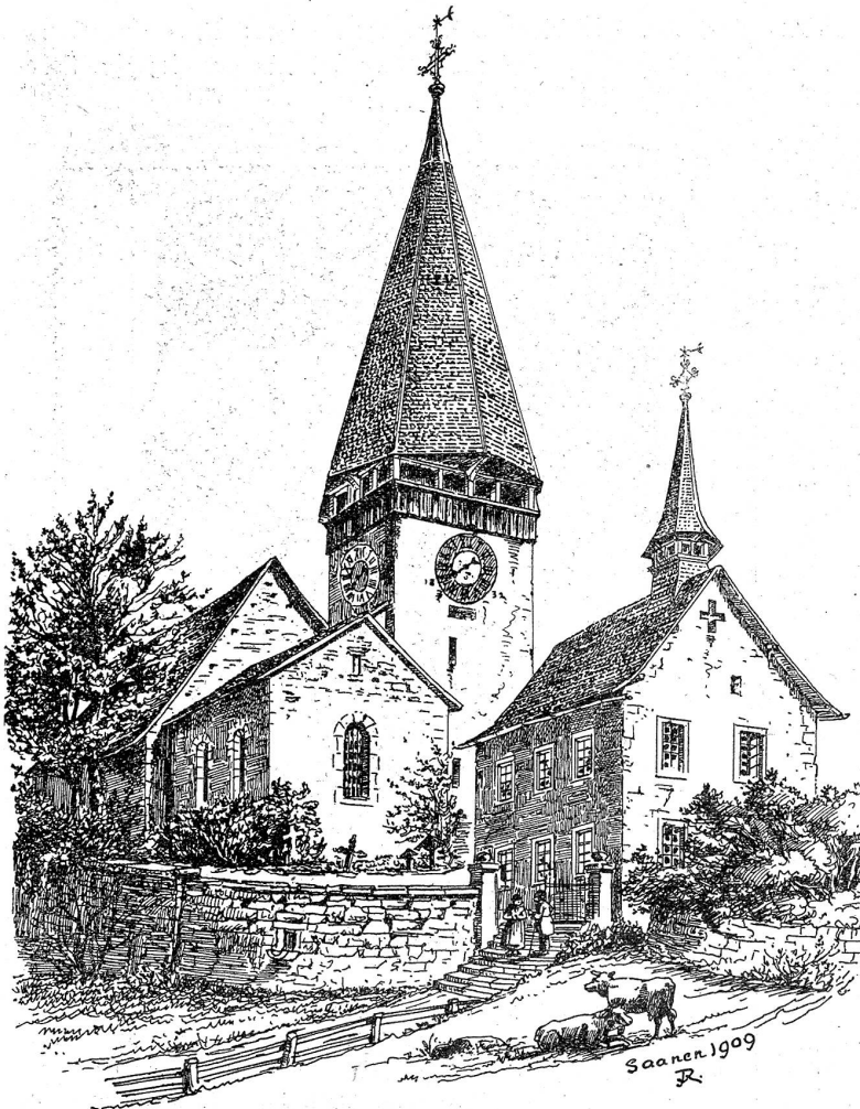
Kirche von Saanen,

1444 neu erbaut, war dem heil. Mauritius geweiht. Daneben das zur Schule umgebauete Beinhaus.