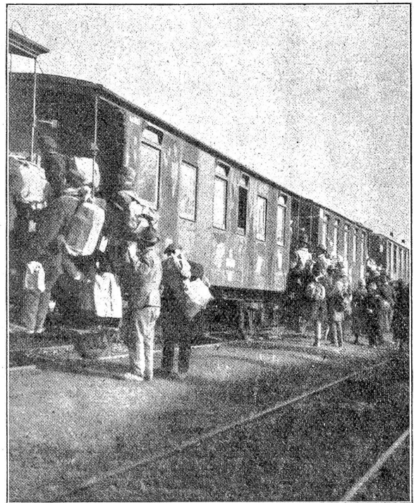
Heimkehrende hamsterer. Das Bild zeigt ferner einen Drittklasswagen, bei welchem deutlich zu sehen ist, daß die meisten Fenster teilweise nicht mehr aus Glas, sondern aus Holz bestehen.

Der Kampf um das Dasein hat viel weniger scharfe Formen angenommen, als dies noch vor einem Jahr der Fall war, wo sich der Pöbel ohne weiteres an die Bäume öffentlicher Anlagen machte. Der eine holte da, der andere dort, jeder nur mit sich selbst beschäftigt. Bäume wurden gefällt, Menschen dabei erschlagen. Ein Ast drang einem jungen Mann in die Brust. Man riß ihm den Ast hinaus und machte sich davon. Das Holz galt mehr als ein Menschenleben! Das ist nun hoffentlich ein für alle Mal vor-