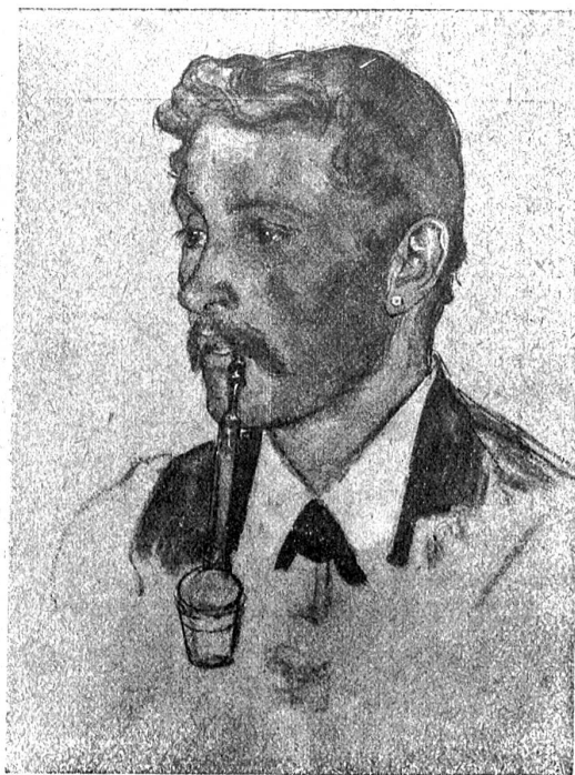
W. Balmer. Unterwaldner Senn, Studie zum Landsgemeindebild.

einige Beispiele aus der Praxis darlege, Fälle, wie sie Tag um Tag in den Sprechstunden vorkommen.