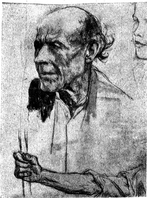
W. Balmer. Unterwaldner Senn, Studie zum Landsgemeindebild.

Häufig muß vor dieser umfassenden, allgemeinen, sozialen Aufgabe die Sorge und Rücksicht für den Einzelnen zurücktreten. Doch lassen sich die beiden Aufgaben nicht voneinander trennen, die eine kann nicht unabhängig von der andern gelöst werden, die richtige Lösung der einen bedeutet im Gegenteil zugleich auch die Lösung der andern. Es scheint mir deshalb gerade in der gegenwärtigen Zeit gerechtfertigt, auch die individuelle, die mehr erzieherische Aufgabe der Berufsberatung zu betonen, und ich glaube dies am besten dadurch tun zu können, daß ich