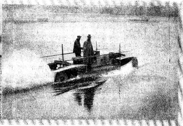
Das schwimmende Automobil von Vargoz.

Stadt Bern und in unserer aufgeklärten Zeit noch möglich sind, das berührt mein Gerechtigkeitsgefühl (oder wie man sich neuerdings ausdrückt, mein soziales Gewissen), und ich denke schon an Wohnungsrationierung und ähnliche Dinge. Doch die Frau erzählt weiter, ohne meine Gedanken zu merken. Und zwar kommt kein Klagen und kein Schimpfen, sondern eher ein Rühmen. Sie ist froh, daß sie gesund ist und jeden Tag verdienen kann für Mann und Kinder. Sie ist Abwaschfrau in einer Konditorei und kann jeden Abend ihren Kindern noch etwas zu essen heimbringen. Mit Freunden zeigt sie mir das Kesselfchen, in dem sie die Speisen heimträgt. Und über ihre Dachkammer schimpft sie nicht und neidet nicht der andern schöne Wohnungen. Denn in diese Kammer scheint Tag für Tag die Sonne, und darüber ist sie froh und glücklich. Mehr als einmal muß sie mir sagen, wie schön die Sonne hineinscheint. Nachdem sich die Türe hinter der reichen armen Frau geschlossen hat, muß ich ein Weilchen den Kopf in die Hand stützen, in mich hineinschauen und mich fragen: Hat nicht die Frau in ihrem Innern die wahre Sonne, die man allen Menschen wünschen möchte. Und ich fühle in mir den Wunsch, diese Sonne auch zu besitzen.