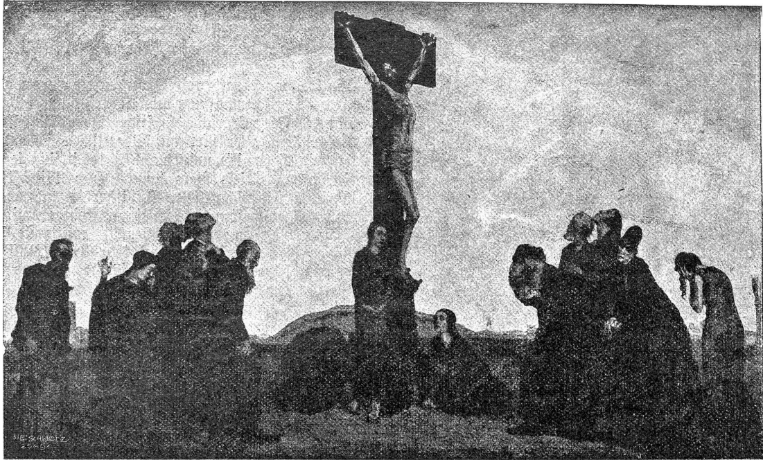
Alfred Marxer: Karfreitag.

(Das Originalbild ist für die protestantische Kirche in Menziken (Aargau) angekauft worden.)