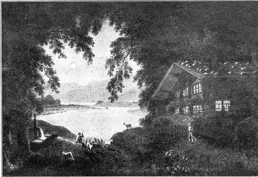
s. N. König.