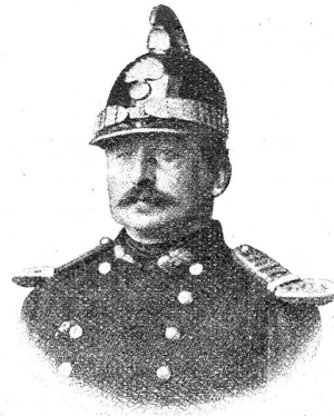
Brandkorpschef Bomonti (1863—1875).