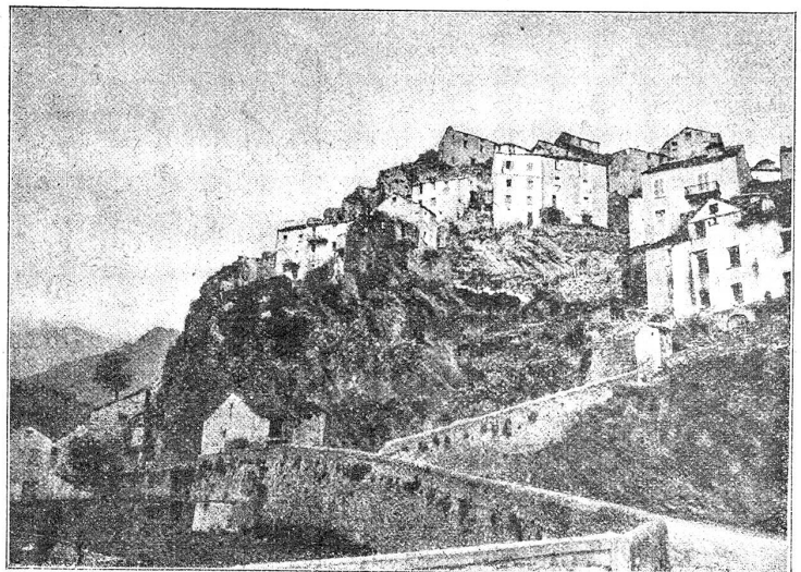
Corte mit der Zitadelle von der Restonica-Brücke.