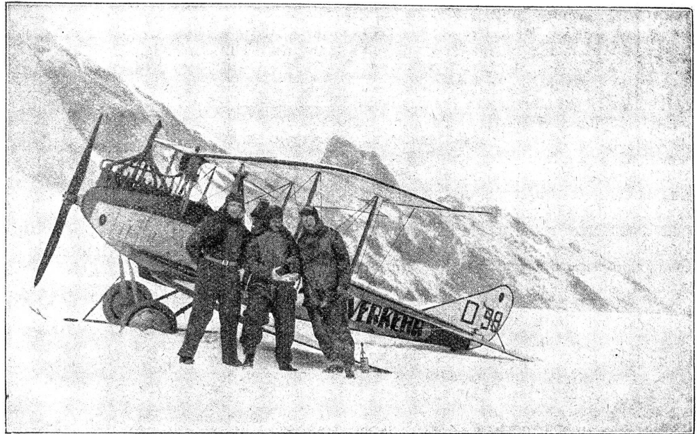
Eine Flugzeuglandung auf der Zugspitze.

Belgrad interveniert also nicht. Indessen das Problem Bulgariens existiert. Und mehr: Die Gruppierung der Balkanvölker in eine französisch-englische Partei, welche im Augenblick herrscht, und eine russisch-deutsche, welche durch die Friedensverträge vergewaltigt wurde, besteht seit vier Jahren, hat bloß die Epoche der dreibundfreundlichen und ententophilen Spaltung abgelöst. Will man wissen, wie drohend die augenblickliche Gefahr einer neuen Entzündung sei, so muß man alle jene Vorgänge beobachten, die sich in Polen, Ostgalizien, Bessarabien und Jugoslawien abspielen; die Ma-