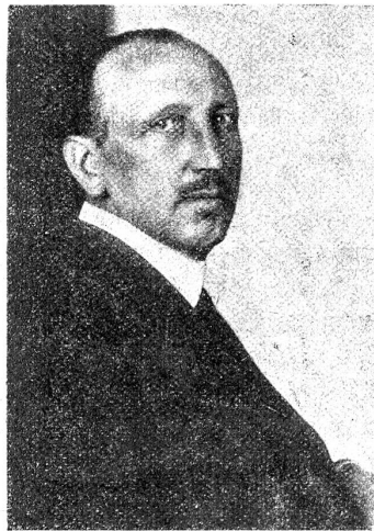
Dr. Hermann Rüfenacht, der neue Gesandte der Schweiz in Berlin.

Ansonsten bezog sich die innerpolitische Diskussion auf die Steuerungsanlagen des eidgenössischen Personals. Auch die Verlängerung der Arbeitszeit infolge der schweren wirtschaftlichen Krise wurde — allerdings auf drei Jahre begrenzt — beschlossen. In dieser Probezeit soll sich erweisen, ob die Warnungen vor der „Arbeitszeit-schablone“ berechtigt waren oder nicht. Ebenso wurden die Einfuhrbeschränkungen wieder verlängert, obwohl sich auch hier schroffe Meinungsdivergenzen gegenüberstehen. Dies gilt auch von der „Förderung des inländischen