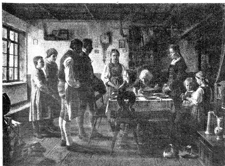
Bilderschau im Berner Kunstmuseum. — B. Vautier (1829—1898): Das Tischgebet.

Eine interessante bernische Künstlerfigur lernen wir im folgenden Raume kennen. Wir beabsichtigen, in einer spätern Nummer auf Franz Adolf von Stürler (Paris 1802 — Versailles 1881) den Schüler und Freund Ingres und Dante-Zeichner und Donator unseres Museums zurückzukommen. Wir bringen hier vorläufig sein Bild (siehe Abb. S. 375), eine feine Bleistiftzeichnung Ingres. Es hängt neben dem wunderhübschen Bleistiftporträts seiner Frau von gleicher Hand im Saal IX, I. St.