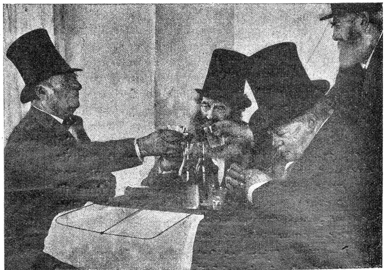
Bilderschau im Berner Kunstmuseum. — Max Buri: Nach einem Begräbnis (1905).