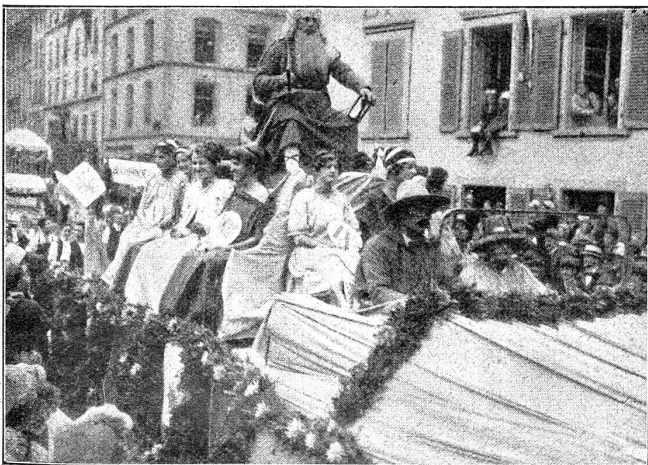
Aus dem Festzug der Gewerbeausstellung. Gruppe der Uhrmacher.

Ein Gang durch die Berner Gewerbeausstellung weckt lebhaftere Erinnerungen an die Landesausstellung von anno 1914. Man wiederholt und vertieft hier mit erneuter Lust Eindrücke, die einem lieb geworden sind. So nüchtern die Erzeugnisse der täglichen Arbeit unserer Handwerker in der Werkstätte und im Atelier anmuten, so unterhaltsam sind sie in der Ausstellung anzusehen; da feiert die Kunst des Dekorateurs — viele Aussteller kamen auch ohne diesen Hergenmeister aus — wahre Triumphe. Gewiß, man vergißt ob