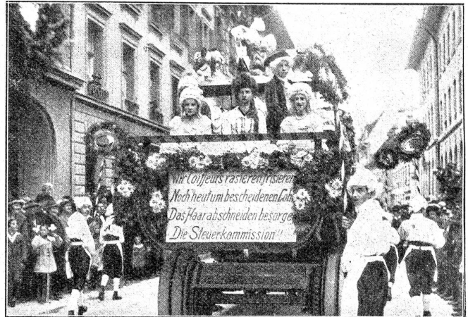
Aus dem Festzug der Gewerbeausstellung. Gruppe der Coiffeurs.

schmutzigen und ruffigen Gesichter und Hände und Kleider der Arbeit. Umso eindrucksvoller kommt die Geschicklichkeit und