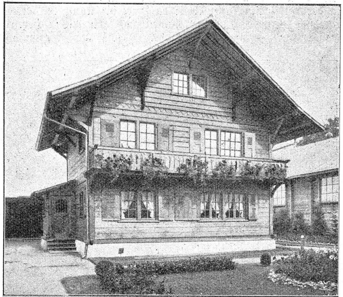
Gewerbeausstellung Bern 1922. Das Chalet der Parquet- und Chaletfabrik A. G. Bern.

Auch wer seine Wohnfrage schon gelöst hat, findet im Chalet der Ausstellung viel Anregung und Belehrung. Einmal kann er die Eigenart der Holzkonstruktion in ihren Variationen bei den Böden- und der Wandvertäfelung studieren. Dann wird er sich die Tatsache merken, daß