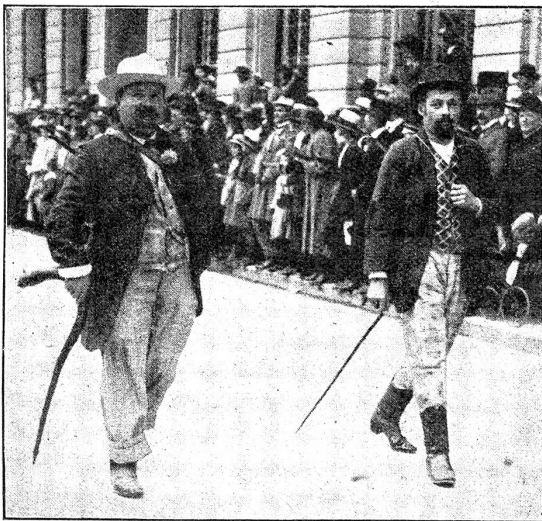
Aus dem Festzug der Gewerbeausstellung. Zwei einstige „dulle Kunde“ (reisende Handwerksburschen).

Bärenmuck usw. mit sich. Eine Ergänzung fand diese Truppe durch ein fornlöhngeschmücktes Auto der Wegmühle mit prall gefüllten Mehlsäcken. Auf einem Wagen war ein alter hölzerner Mühlengang zur Schau gestellt. Eine der hübschesten Gruppen waren die Milchhändler. Die Milchträgerinnen mit ihren Brenten führten an; dann kam der hundebespannte Milchwagen mit hölzernen Milchgefäßen, der mit galvanisierten Blechgeschirren und schließlich das neuzeitliche Milchauto. Das Küher-Doppelquartett hatte auf einem Wagen Platz genommen und erfreute durch seine prächtigen Todelieder. — Den Zuckerbäcker mit ihren kunstvollen Kuchen und Aufsätzen und den reizenden Spezialitätengruppen jubelte das Publikum freudig zu. Besonders die Jugend freute sich ob dem pelofahrenden Osterhasen. — Die Gruppe der Weinhändler und Wirte ließ die verschiedenen Kategorien Wirtpersonal, auch den befrachten Kellner, aufmarschieren. In einer auf einem Auto placierten Wirtschaft „Krug zum grünen Kranz“ hatte eine fidele Gesellschaft Platz genommen. — Die Teigwarenfabrikanten staffierten ein stattliches Auto mit ihren schönen Backungen aus, auf deren Beigen ein großes Ei balancierte.