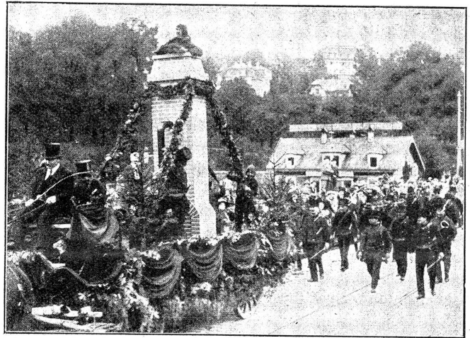
Aus dem Festzug der Gewerbeausstellung. Gruppe der Kaminfeger.

blauen Schürzen kenntlich. Lehrlinge und Kinder, letztere in Hutten, trugen die verschiedenen Bäckereien wie Züpfen,