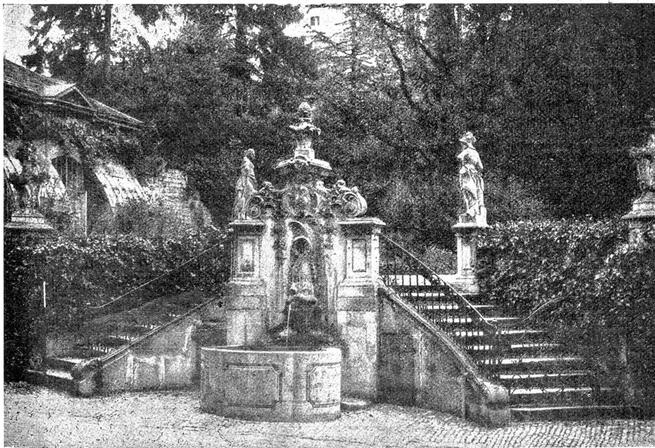
Zürich. Im Garten des Hauses „zum Reiberg“. Um 1770. (Druckstock aus „Die alte Schweiz“.)

Die Zeilen, die wir dem Werke*) widmen, sollen keine Buchbesprechung sein. In Dankbarkeit wollen wir bloß einige Gedanken aufzeichnen, die uns das Studium des Buches eingab. Vorerst aber der Herausgeber zu gedenken, ist unsere Pflicht. Ein seltenes Zusammentreffen hat hier durch die Arbeit von drei Personen ein Werk aus einem Geist und Guß entstehen lassen. Der Vortritt gebührt der umsichtigen Herausgeberin, Dr. E. Maria Blaser, vom Kunstgewerbemuseum in Zürich. Wenn sich das fertige Buch so schön und wohlgeordnet anfieht, so darf nicht vergessen werden, wie viel Liebe und Freude für die gute Sache es brauchte, bis das strenge und zielsichere Auge der Herausgeberin ihr Platz gegeben hatte. All die schönen und zum Teil noch wenig bekannten Zeugnisse unserer Baukunst und des Handwerks ausfindig zu machen, die Leute zu finden, die ihnen photographisch beizukommen gewußt haben, zu sichten, zu ordnen, zu verzeichnen, ist das Verdienst