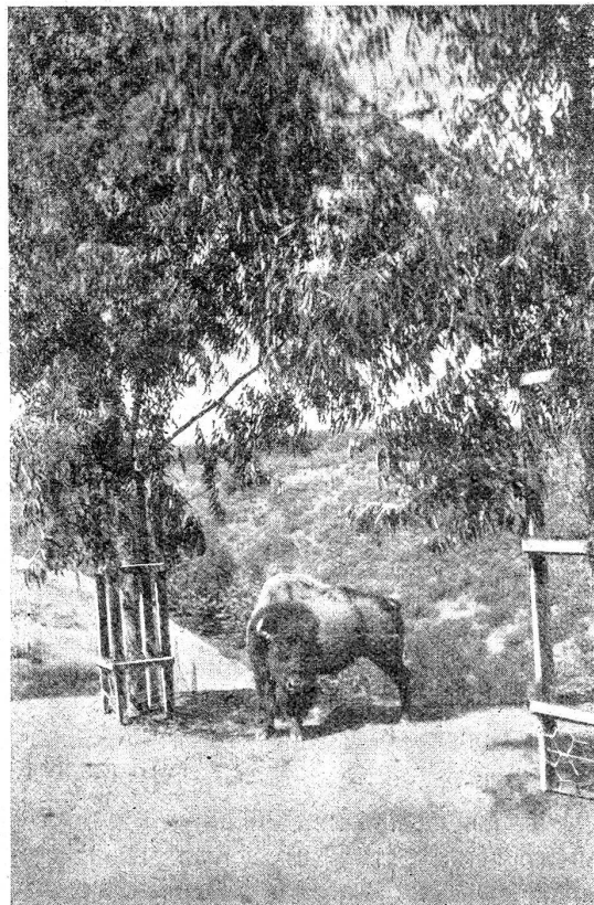
Prachtsbüffel im Park von San Diego, Kalifornien, unter einem rotblühenden Pfefferbaum.

Eine geradezu unheimliche Stoffmenge ist auf den 284 Seiten von R. Zurbuchens Reisebuch verarbeitet. Schon die respektable Kilometerzahl der bewältigten Reiseroute läßt hierüber Schlüsse ziehen. Sie geht — auch wenn von den