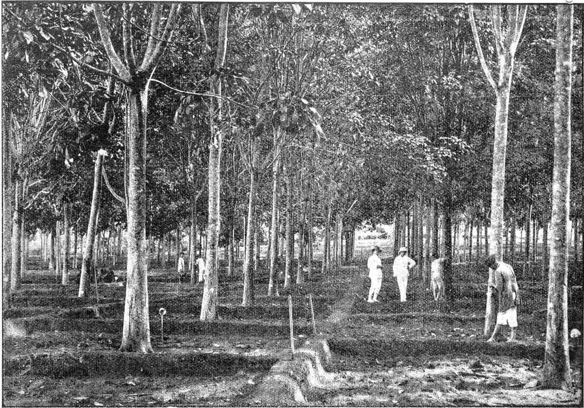
Gummikultur auf Sumatra. Zapfbare Gummibäume, 12 Jahre alt. Zwei Schweizer als Assistenten.

den. Pfähle kann man den Gummibäumen nicht beigegeben, wegen der drohenden Fäulnis.