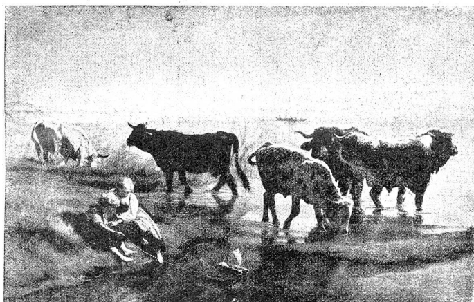
Rudolf Koller, Zürich 1828-1905. Vieh am See. 1870. Original im Zürcher Kunsthaus.