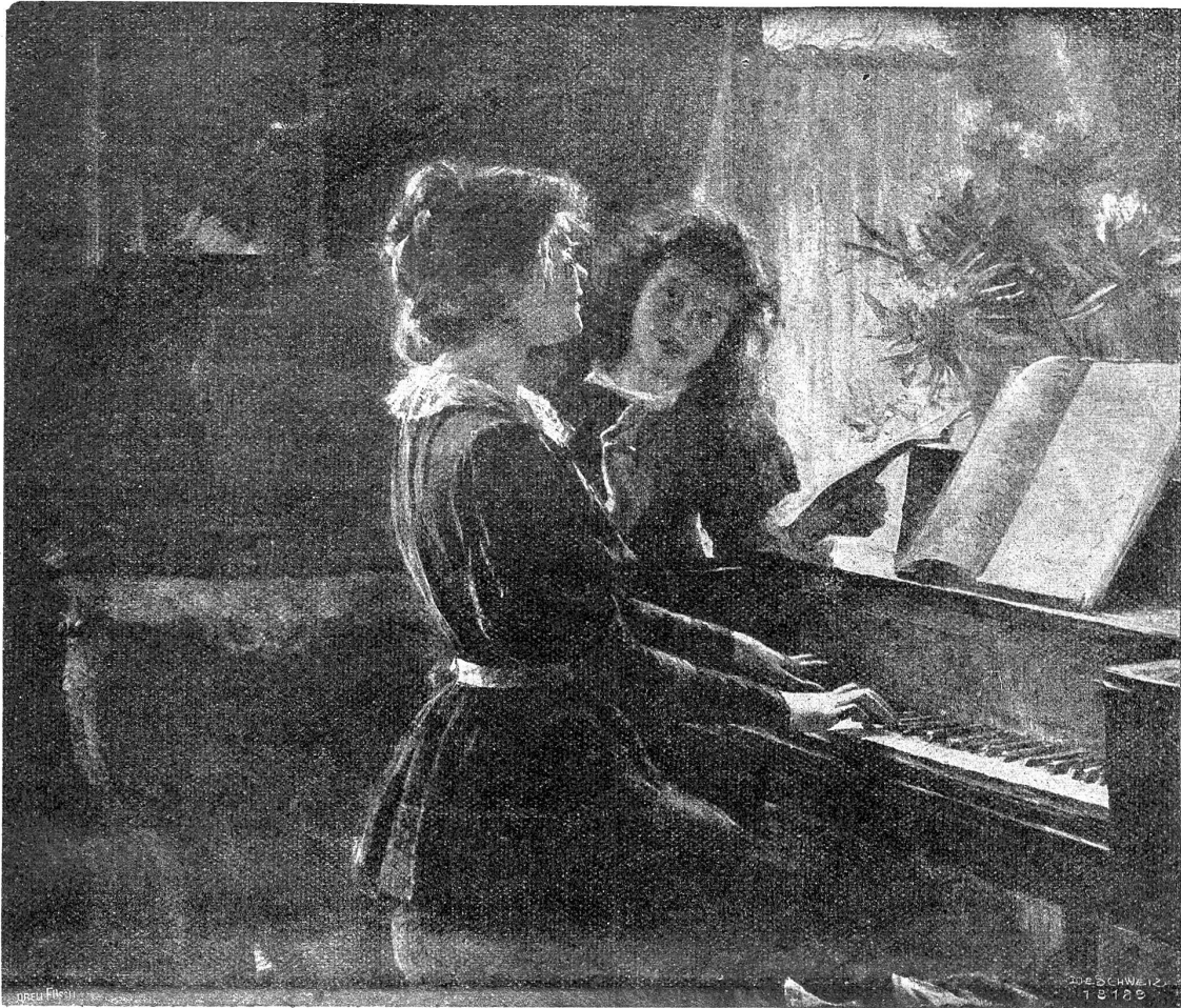
Louise C. Breslau: Das Kinderlied.

Vorstellungen ausgedacht hatte, für den sie nun aber gewillt gewesen wäre, allerlei Opfer aus dem Schatz der angstvoll gehüteten Habe zu bringen — wenn sich das nur alles in seinem Zusammenhang hätte klar ausdenken lassen! Aber Geist und Seele verwirrten sich immer wieder; Einfälle tauchten auf, die oft ganz im Gegensatz zu Fräulein Sabines früheren Lebensgrundsätzen standen, aber eine gewisse Erleichterung brachten; doch sie gerieten ebenso plötzlich in Vergessenheit und waren trotz aller Bemühung nicht wieder zu finden. Nur eines war gewiß: eine schwere Angst und Beklommenheit lastete im Innern, und je weiter das Leben entschwand, umso drückender wurde sie. Und aus der unerhellten Tiefe drangen Gefühle herauf, die der unberrückten Gedanken in schredhafte Phantasien kleidete.