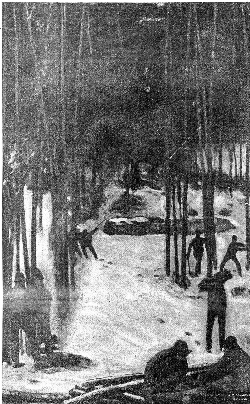
Alfred Kolb, Winterthur: Holzfäller (Ölgemälde) 1917.

Lena preßt plötzlich die Hände an die dumpf brausenden Ohren, und macht eine scheue Bewegung, als ob sie fliehen möchte; es jagt sie fort aus der Nähe dieses niederzwingen-