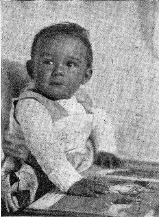
Mich pflegt eine liebende und verständige Mutter, was sollte mir fehlen? Gedenket der Kinder, die dieses Glück nicht genießen!

Lena hat mit übernatürlicher Kraft gesucht, das Beben ihrer Nerven zu meistern und ihre straffe Haltung zu gewinnen. Sie wendet sich zu Frau Schmidt und sagt leise: „Ich danke Ihnen, Sie Gute!“