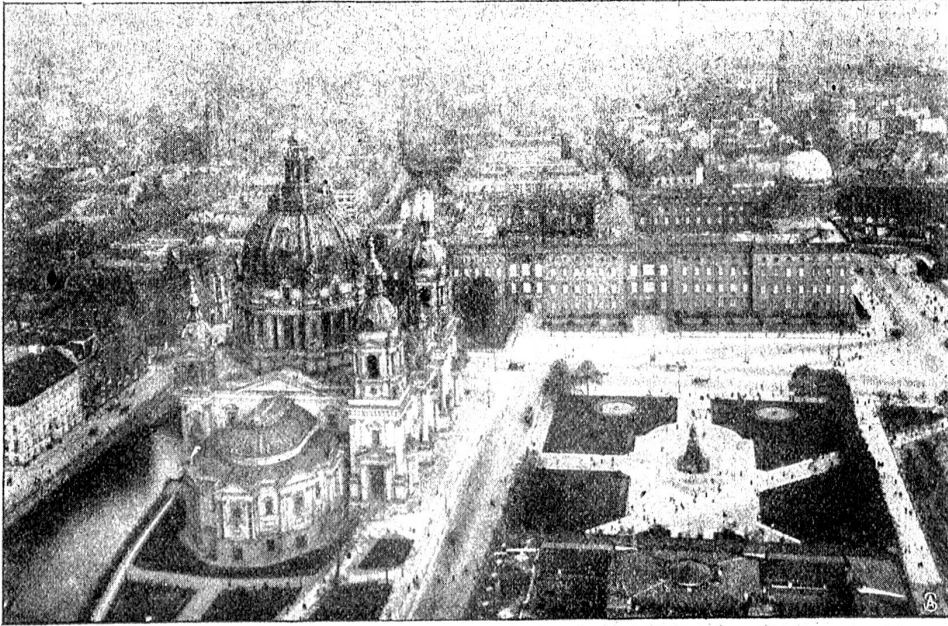
Dom, Schloss und Lustgarten.

daß nun bald große Kontinente zwischen ihnen lagen. Näher und näher trat die Drohung der Trennung durch unendliche Meere, die nicht mehr zu überbrücken waren.