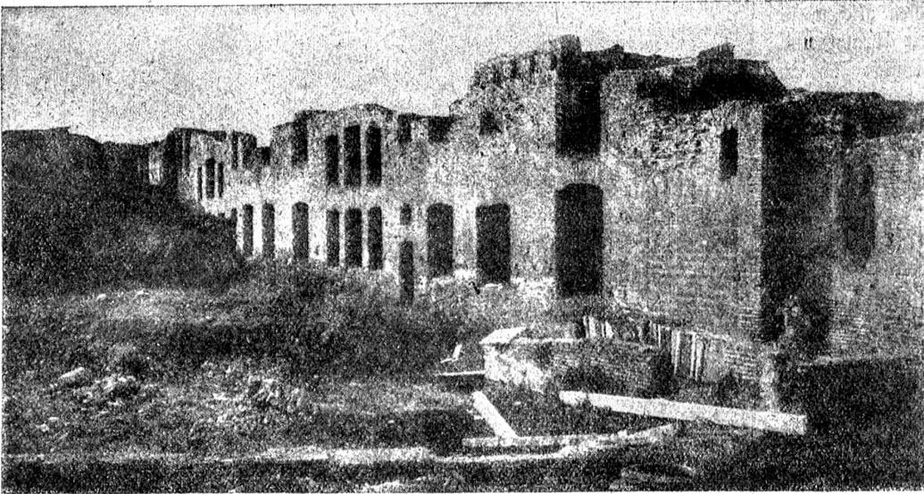
In Ostia ausgegrabene antike Privathäuser aus der Mitt. des 2. Jahrhunderts n. Chr.: Ansicht der Gartenseite.

sich nach dieser Ergriffenheit, als sei sie ein Mittel zur Befreiung von seinem untätigen Dahinträumen. Als liege eine Kraft in ihr, die ihn wieder zum Maler machen könnte.