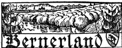
† Franz Sonthheim,

Der schweizerische Tonkünstlerverein eröffnet auch dieses Jahr eine Bewerbung um fünf Studienstipendien für junge Musikstudierende bei der Schweizerischen Musikgesellschaft. Der Wettbewerb findet im Juli nächsthin statt. Auskunft über die Bedingungen erteilt Herr Emile Lauber, St. Aubin, Neuenburg, Sekretär des schweiz. Tonkünstlervereins. —