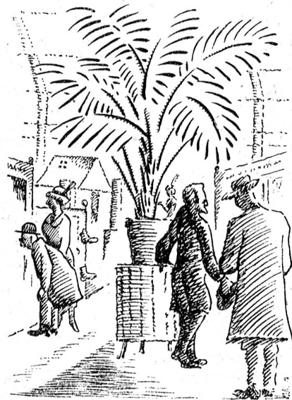
Eine Ecke in Halle Nr. 11.

Die Schweizer Mustermesse ist eine Notwendigkeit geworden, seitdem das Ausland durch seine staatlich geförderten Mustermessen auf die Schweizer Käufer von Jahr zu Jahr größere Anziehungskraft ausübt. Will der Schweizer Produzent den Inlandmarkt nicht an die Auslandproduktion verlieren, so muß er sich sputen und die im eigenen Lande gebotene Möglichkeit, zu seinen alten Kunden neue zu erwerben, rege nutzen. Eine zahlreiche Besichtigung der Schweizer Mustermesse in Basel ist in der gegenwärtigen Zeit doppelt wichtig. Wer nicht ausstellt, arbeitet direkt der ausländischen Konkurrenz in die Hände.