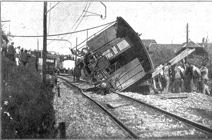
Vom Eisenbahnunglück in Wabern.