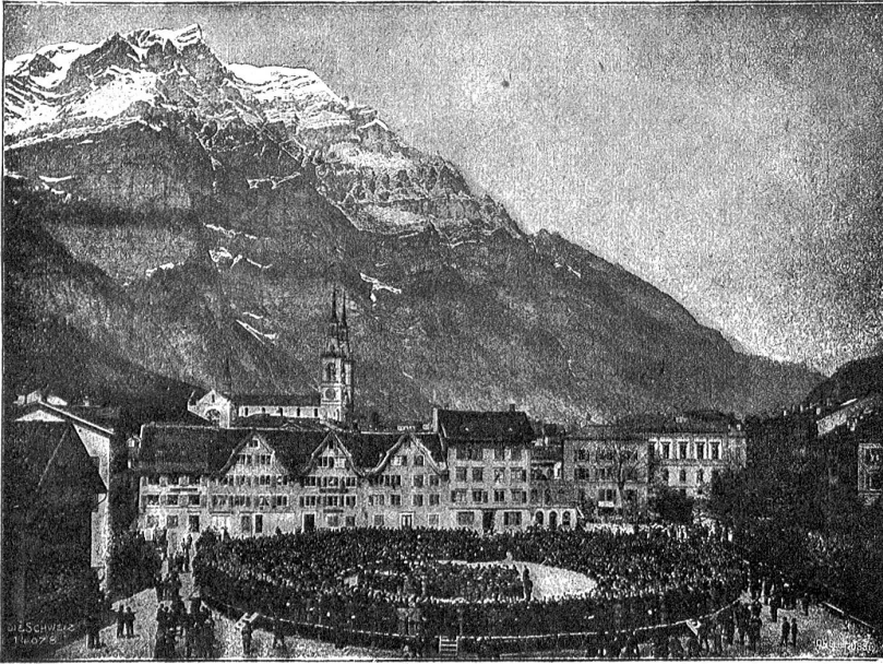
Landsgemeinde in Glarus.

über uns gekommen, das klüger war als ich, und hätte mich frei gemacht.“