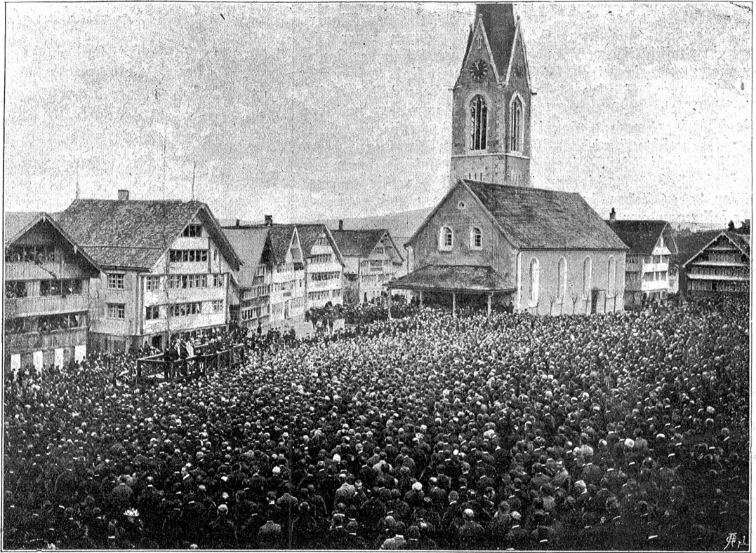
Die Appenzeller Landsgemeinde (A.-Rh.) in Hundwil.

haus zu Altdorf. Auf dem Platze vor dem Telldenkmal empfängt ihn eine militärische Ehrenkompanie mit dem Landespanner, der Musik und den beiden Harshornträgern unter dem Spiel des Fahnenmarsches. Nachdem sich auch die übrigen Mitglieder der obersten Behörden eingefunden haben auf dem Rathaus, setzt sich von da aus der Landsgemeindezug nach Böhlingen in Bewegung. Voran schreiten die beiden sogenannten „Tellen“, die, in altturnerische gelbschwarze Kriegertracht gekleidet, die mächtigen Harshörner auf den Schultern tragen. Ihnen folgt die Musik und die Ehrenwache mit dem Landespanner, unter dem Befehl eines Oberlieutenants.