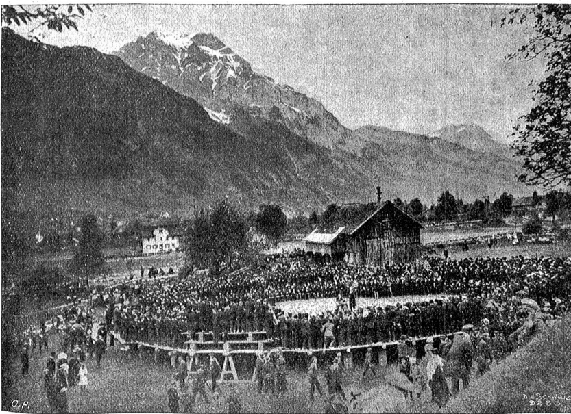
Die Urner Landsgemeinde in Bözlingen an der Gand bei Altdorf.

Der Schauplatz der Nidwaldner Landsgemeinde (zu Wyl an der Aa, am Weg zwischen Stans und Buochs) ist durch Weltis und Balmers Landsgemeindebild im Ständeratsaal allgemein bekannt geworden. Er ist durch ein niedriges Mauerviereck nach außen abgegrenzt und auf allen vier Seiten von mächtigen Kastanienbäumen umgeben. An den drei Eingängen des „Ringes“ ist je ein Doppelposten mit aufgepflanztem Bajonett