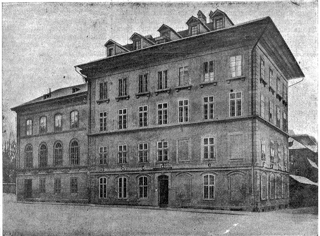
Die alte bernische Staatsapothekerei in Bern.

„ Tschirch lernte auch herndeutsch und gewann den Bernersschlag lieb; aber wir können ihm nach den Stilproben, die er von unserer Sprache gibt, kein gutes Zeugnis über sein Berndeutsch ausstellen. Er sagt: „Chrüessch wohl!“ und „ei Gwundernase aus Dütschland“ — „I hei's nie gnuce