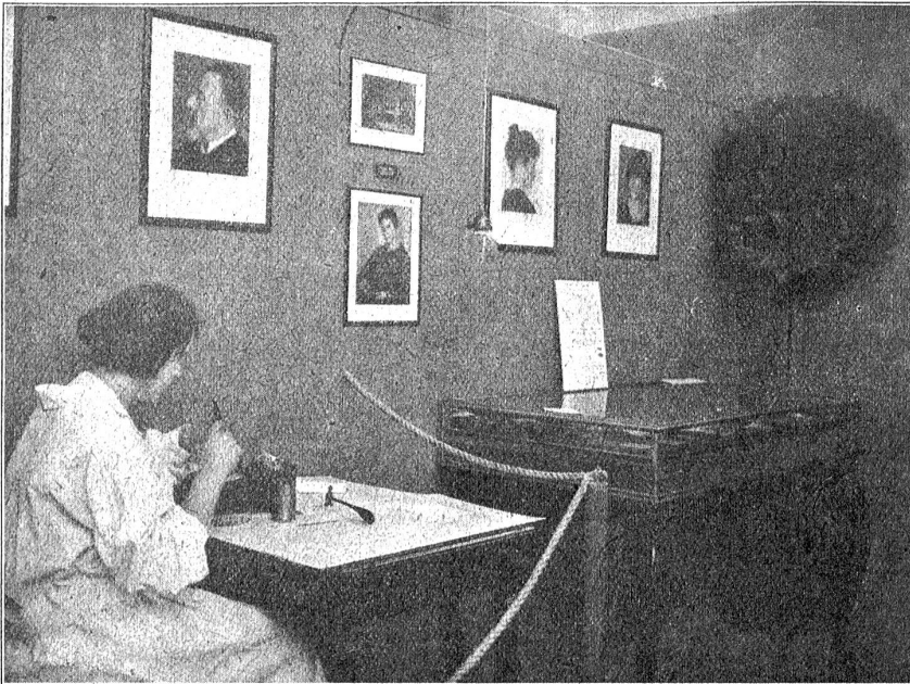
Gold- und Silberschmiedearbeiten (Sräulein Ruof). Photographie (Atelier Zumbühl): Sräulein Karl. Phot. Zumbühl, Bern.

Brief enthielt über die Heimreise nur die Bemerkung, man könne an eine solche noch nicht denken, da immerhin der Zustand der jungen Mutter und des Kindes einige Rücksicht erfordere.