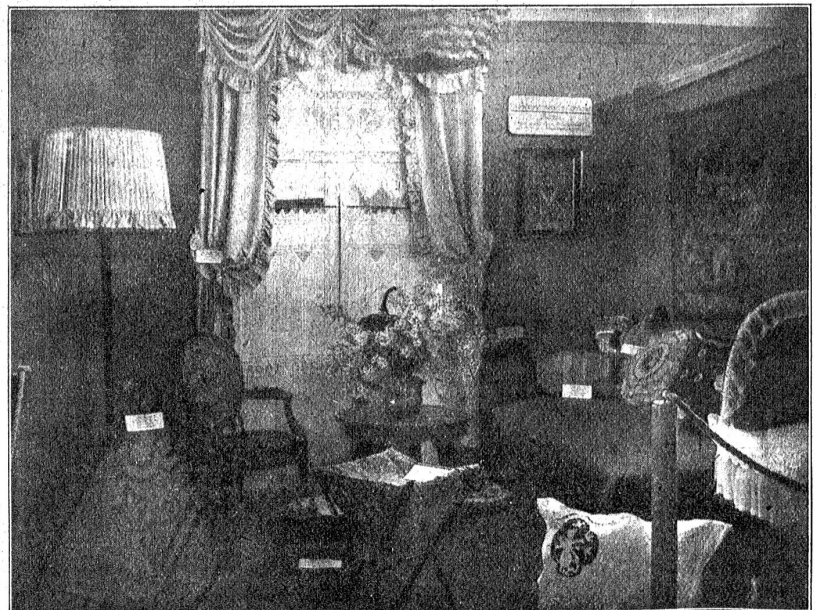
Ausstellung des Capezierermeisterverbands Bern. Arbeiten, ausgeführt von Arbeiterinnen in städt. bernischen Geschäften.

Nun ist das Werk, an dem die bernischen Künstlerinnen und Gewerblernen seit dem Sommer gearbeitet haben, vollendet. Die erste Ausstellung für Frauengewerbe, einschließlich Kunstgewerbe und Hauswirtschaft, die in der Schweiz stattfindet, hat ihre Tore geöffnet. Es ist keine große Ausstellung, in der man stundenlang herumspazieren kann, um schließlich müde Augen und Beine zu bekommen, aber eine feine, gediegene Schau, die erfrischt, anregt und Respekt einflößt. Denn zum erstenmal sehen wir hier auch die Arbeiterin selbst ausstellen, leistet sie nicht nur einen Beitrag an irgend ein Serienwerk, sondern tritt mit einer selbstgemachten, individuellen Arbeit auf. (Siehe z. B. die