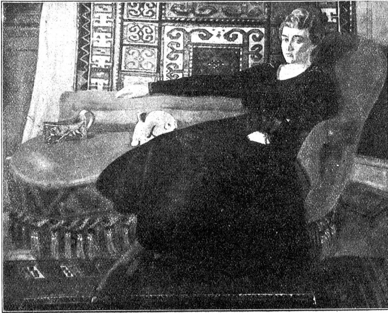
Gottfried Christen. Damenporträt. 1917. (In Tempera.)

Schaudernd bedeckt es beide Augen mit den Händen; aber das gramverzehrte Gesicht wird deutlicher, größer und dunkler sind die Augen und blicken es drohend an. Jetzt steht er unterm ewigen Licht vor seiner Bahre, eine Hand streckt er aus, die andere trägt das Kreuz, er kommt näher; aber das sind nicht Friedlis Augen, so groß und flehend. So streckt er die Hand, als ob er sich wehren müßt vor ihm: „Du, was tust du mir in meiner Totenruh! So laß mich rein, du, vor den Leuten!“