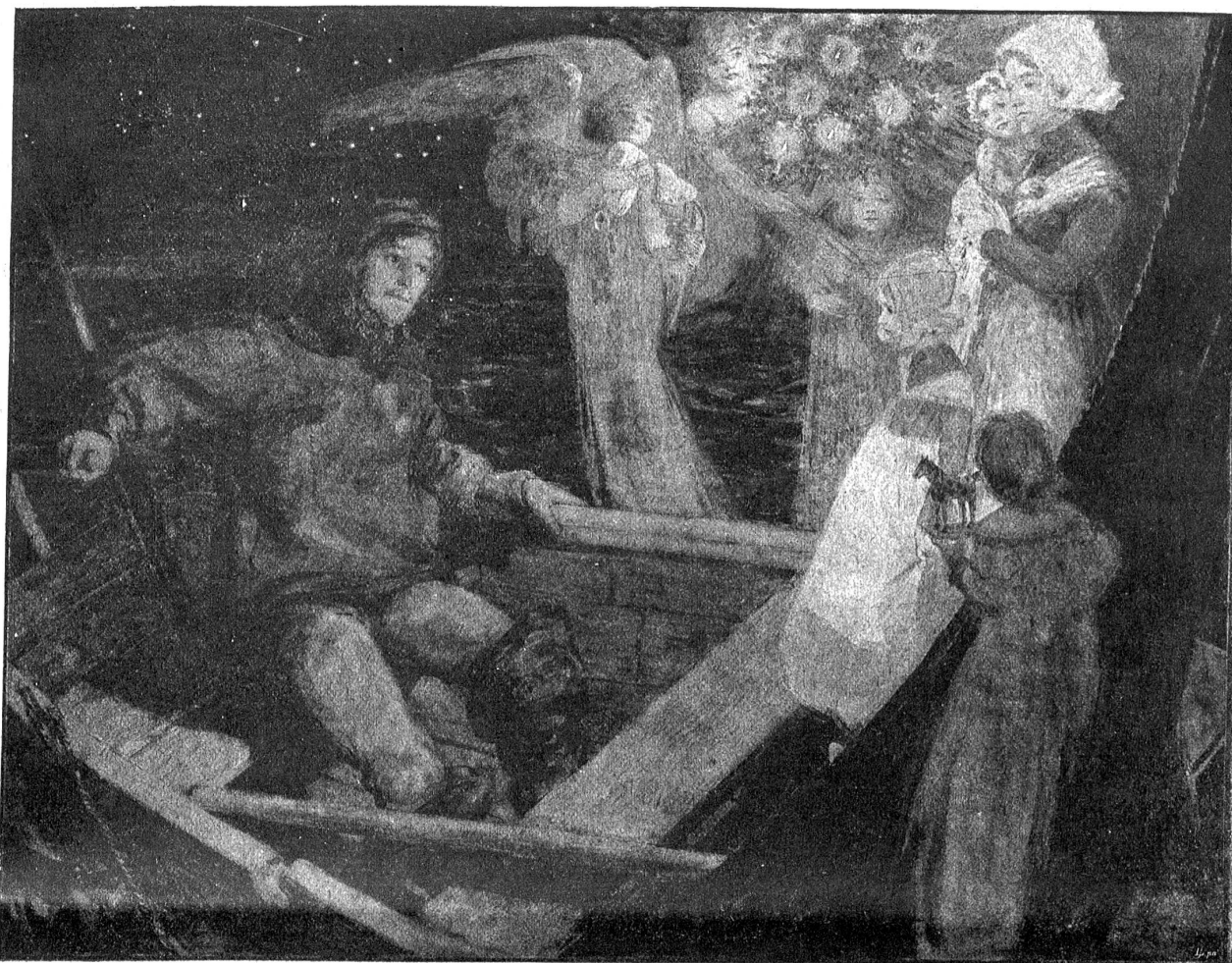
In der Christnacht. Nach der Originalzeichnung von R. Gepling.