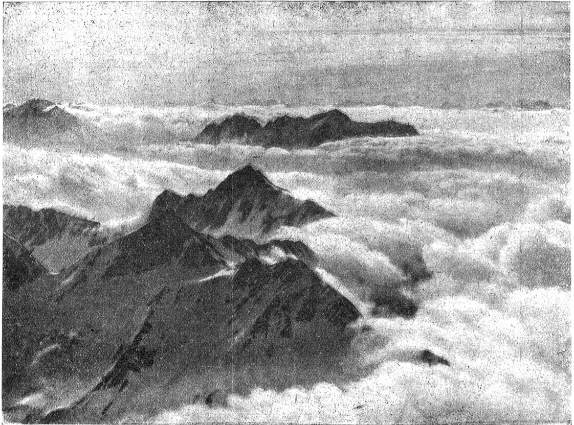
Nebelmeer über dem Lukmanier. Vordergrund: Piz Blas, Piz Rondadura. Mitte: Scopi; von W. Fliegeraufnahme von W. Mittelholzer von der Ad Astra-Aero A.-G. (Druckfoto aus: „Die Schweiz aus der Vogelschau“)

schon seit einiger Zeit. Es sei nur auf die zahlreichen Photographien des Luftschifferkapitäns Spelterini hingewiesen. Das von ihm begonnene Werk hat nun W. Mittelholzer in einer Art ausgebannt, die restlos Anerkennung verdient. „Das Photographieren vom Flugzeug aus — schreibt Prof. Flückiger — ist eine seltene Kunst, ein Privileg Weniger, geblieben. Der rasche Flug, das Vibrieren des Apparates beim Rasen des Motors, die empfindliche Kälte in großen Höhen und, nicht zum geringsten, die Nötigung, in bisweilen akrobatenhaft verrenkten