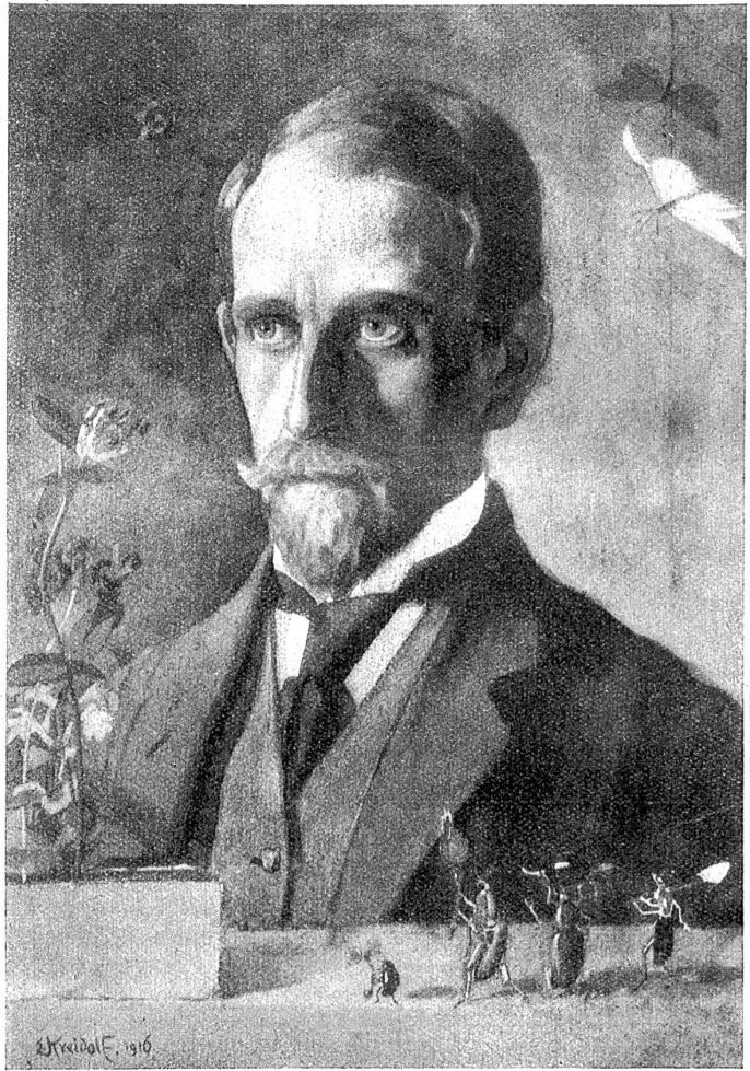
Ernst Kreidolf : Selbstbildnis.

Charlotte seufzte. „Ich weiß eben nicht, was ich wünschen soll. Wenn ich ein Mann wäre, so wüßte ich es. Ich würde in einer großen Stadt studieren, Geschichte oder Biologie oder Nationalökonomie, irgend eine Materie, die von einer Seite dem Menschen und der Menschheit beikommt; nebenbei ginge ich so viel als möglich aus, in die politischen Räte und Versammlungen, in die Armenquartiere und Zufluchts Häuser, in Theater und Lokale, wo die Großstadtgesellschaft hingehet — ich hätte reichlich ein paar Jahre zu tun, und nachher wüßte ich wahrscheinlich, wo ich mich hinstellen oder ob ich weiter lernen und sehen sollte. Vielleicht würde ich mir eine Familie gründen; vielleicht würde ich die Freiheit vorziehen, um einem Herzensberuf zu leben. Möglicherweise könnte ich diesen Plan auch als Mädchen ausführen, aber nur in sehr beschränkter Weise; und darüber eben hoffte ich, Sie befragen zu dürfen. Ich werde ja einen Bruch zu Hause riskieren müssen, und das ist