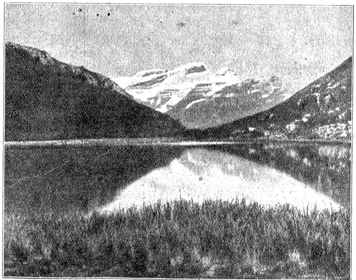
Umgebung von Leysin. — Lac d'Al (2100 Meter).

Die Reinheit der Luft ist oft untersucht worden; ihr