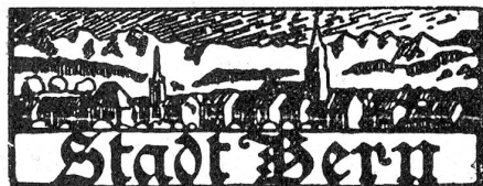
† Helene von Müllinen.

In der Detailberatung gab zu reden: die durch Spruchpraxis des Bundesgerichtes bedingte Erhöhung der steuerfreien Domizilfrist von 30 auf 90 Tage, die Steuerfreiheit für Korporationen, die sich mit Altersfürsorge befassen usw. Bei der Festlegung der steuerfreien Abzüge blieb unbestritten die Heraufsetzung des Existenzminimums von Fr. 1000 auf Fr. 1500 und die Zulassung eines Hausabzuges von Fr. 300. Für Kinder bis zu 18 Jahren können in Zukunft Fr. 200 abgezogen werden. —