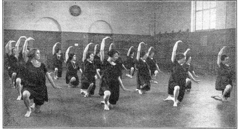
Momentbild aus einem rhythmischen Freiübungsreigen der Damenriege des Turnvereins Länggasse Bern.